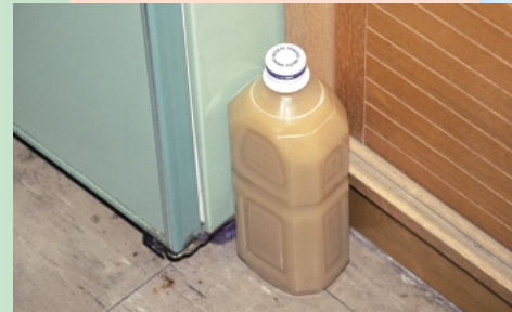
④冷蔵庫の横などの温かいところに置いて4~7日で出来上がり。