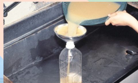
②①をジョウゴを使ってペットボトルに入れます。