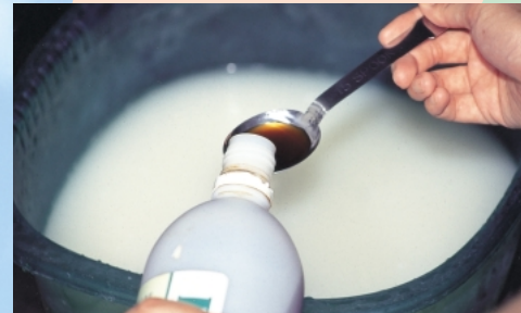
①ボールに右記のEM1と糖蜜、米のとぎ汁を入れ、よくかき混ぜます。